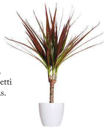
▲ La dracena è chiamata anche tronchetto della felicità.

I tulipani proteggono dai vapori dell'ammoniaca, mentre i gerani , la citronella , la menta e il basilico tengono lontane le zanzare e molti insetti.