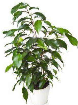
▲ Il ficus può crescere molto anche in vaso.

Il ficus depura l'aria dal fumo, ma anche dalla trielina che si trova negli inchiostri, negli adesivi, negli smalti e assorbe gli odori sgradevoli.