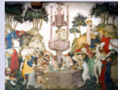
rappresentazione della vita