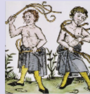
per espiare i propri peccati, alcuni usavano punizioni carnali. erano chiamati flagellanti

elemento caratteristico : la falce la peste si pensava fosse una punizione divina