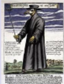
metodo per evitare il contagio

portata dalla Cina in Europa tra il 1347 e il 1348 totale mancanza di igiene influisce sulla diffusione delle malattie, le medicine non erano molto sviluppate