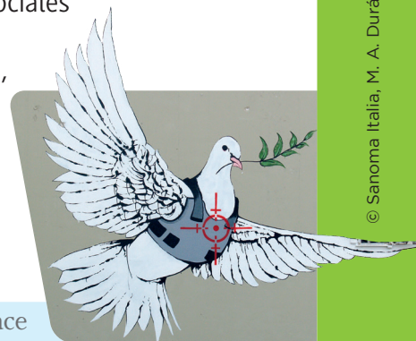
Banksy, Armoured Dove of Peace

¿A qué poderes sociales (nobleza, Iglesia, Ejército, Gobierno, pueblo...) se refiere cada verso de esta estrofa?