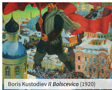
Boris Kustodiev Il Bolscevico (1920)

I colori sono da sempre un tratto connotativo nell'iconografia delle rivoluzioni, dei movimenti e dei partiti politici. Nel Novecento, i colori sono diventati strumento di propaganda politica: il nero del fascismo e il rosso della rivoluzione.